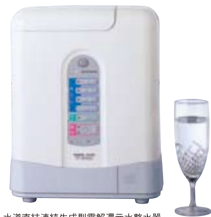
水道直結連続生成型電解還元水整水器 TRIM ION TI-8000

標準本体価格 ¥249,900 (税抜¥238,000) <消費税込> (取付工事費別)